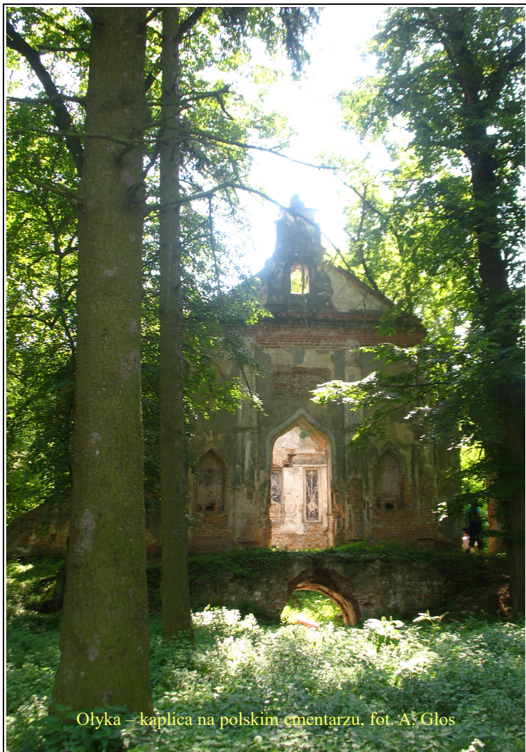
Olyka – kaplica na polskim ementarzu